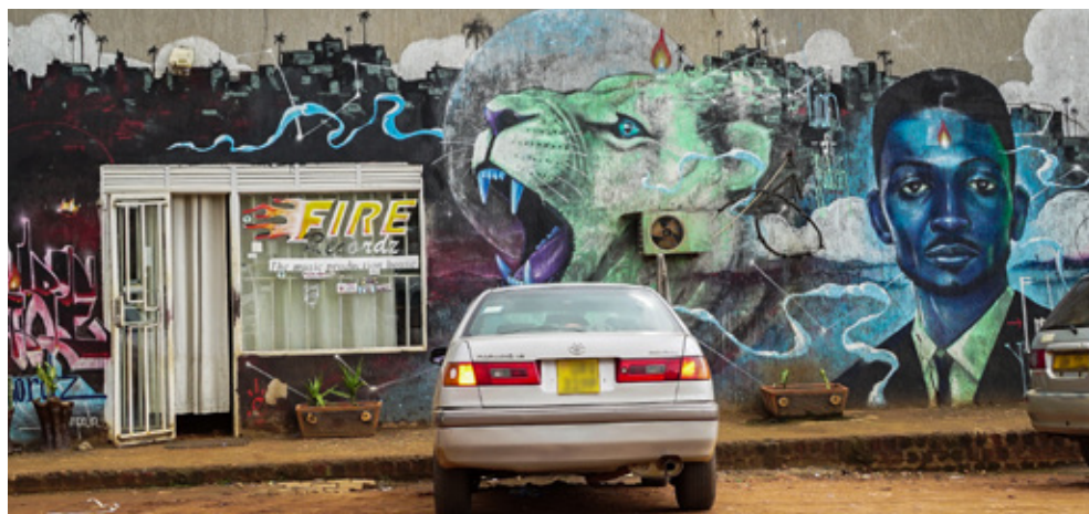
Muurschildering van Bobi Wine, Kampala

Wat volgde was een decennium van vallen en opstaan; hoogte-