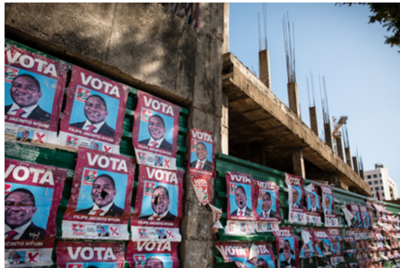
Een stilgelegd bouwproject in Maputo