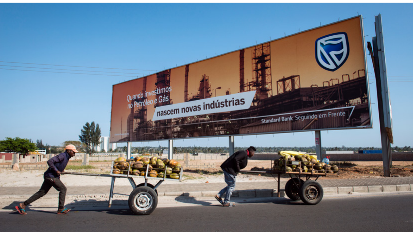
Kokosnootverkoopers passeren een billboard van Standard Bank, met de tekst: 'Wanneer we investeren in olie en gas, worden nieuwe industrieën geboren.' In 2011 zijn in Mozambique nieuwe aardgasvelden ontdekt

gezichtsverlies lijden. Alleen op die manier ontstaat er debat.