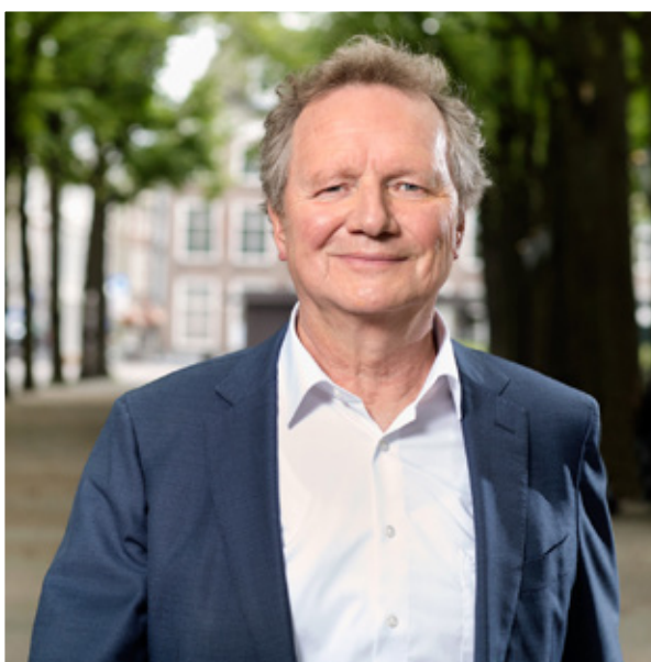
Bram van Ojik (GroenLinks)